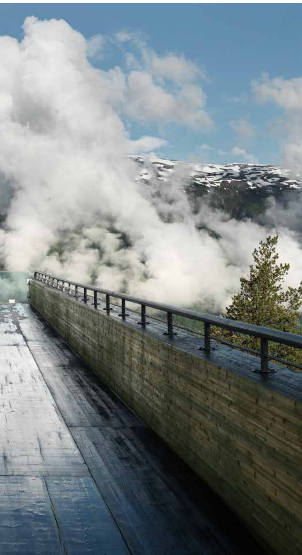
en ny måte: Utsiktsrampa Stegastein svever 30 meter ut over furutoppene 640 meter over Aurlandsfjorden.